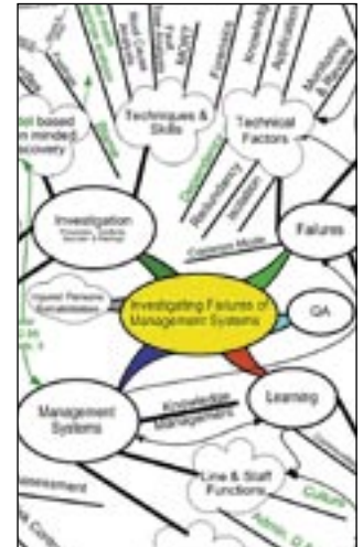
Bild: Investigating Failures of Management Systems

Der Kaskadenkondensator dankt in der Saison 05/06: (Stand bei Datum der Drucklegung) Lotteriefonds Kanton Basel-Land ✧ Ernst Göhner Stiftung ✧ National Versicherung ✧ Fondation Nestlé pour l'Art